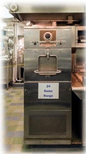
Forno de micro-ondas do navio NS Savannah de 1961.

Sabia que o forno micro-ondas já existe há 70 anos? Sim, é verdade.